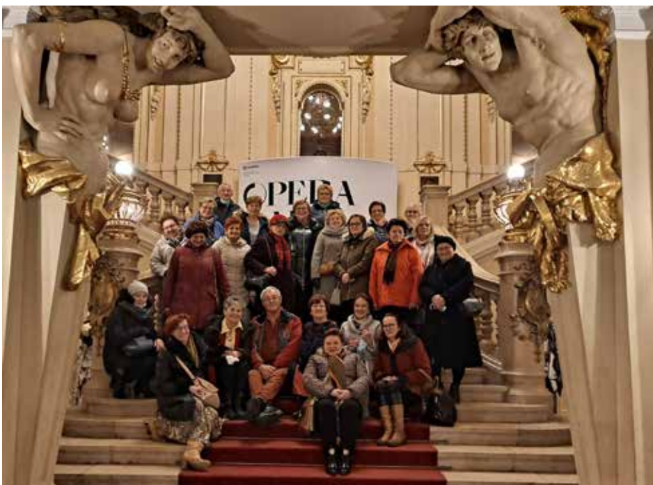
Wyjazd do opery