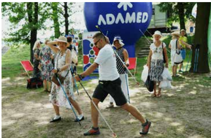
Nordic Walking