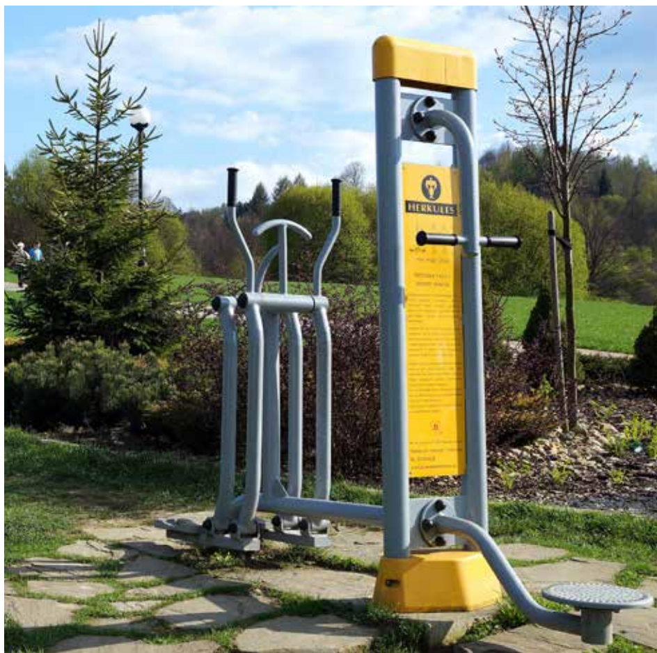
Siłownia „pod chmurką”

łaś z „siłowni pod chmurką” na terenie miasta Nowego Sącza?