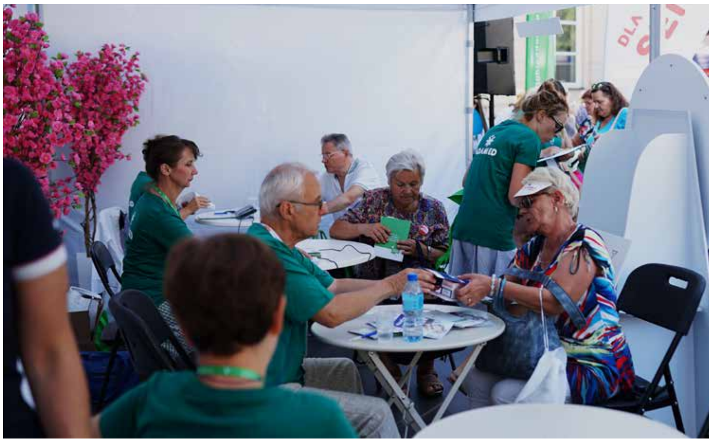
Badania profilaktyczne

trzeby seniorów w Polsce, by móc jak najlepiej ich wspierać. A z kolei, by seniorzy jak najdłużej mogli się cieszyć dobrym zdrowiem oraz pielęgowali i rozwijali swoje pasje. Widzimy sens naszych działań niemalże każdego dnia. Dlatego też będziemy kontynuować nasze działania. Chciałam w tym miejscu złożyć także serdeczne podziękowania za Państwa wsparcie i liczymy na dalszą współpracę.