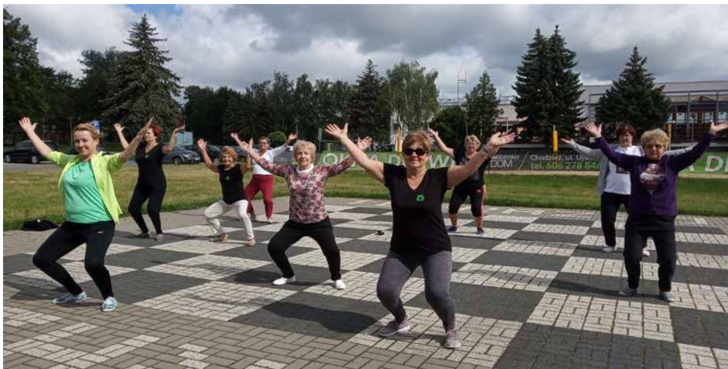
Zajęcia ruchowe w plenerze.

Z nadzieją czekaliśmy na rozstrzygnięcie projektu z MRiPS w ramach programu wieloletniego na rzecz osób starszych „Aktywni+” na lata 2021/2025. Otrzymałiśmy dofinansowanie, w ramach którego odbyły się szkolenia, mające na celu podniesienie umiejętności posługiwania się nowoczes-