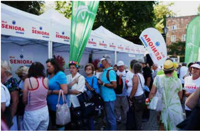
Piknik Pokoleń