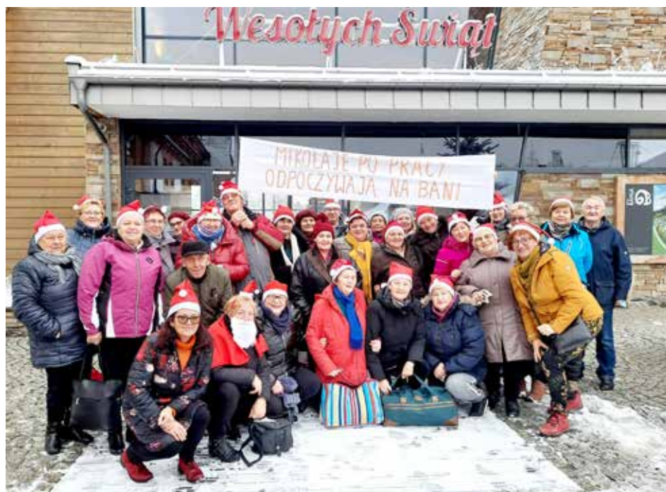
Wyjazd do term

Osoby starsze chcą czuć się potrzebne. Chcemy pomagać! – Ale jak? Zaczęliśmy od kontaktu z właściwymi służbami w celu pozyskania informacji, jaka pomoc jest potrzebna. Odzew na apel