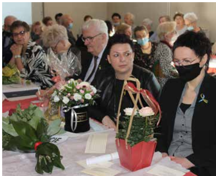
Jubileusz 10-lecia Gminnego Uniwersytetu Trzeciego Wieku w Gołuchowie, fot. Farida Leśniewska, Damian Cieślak

stwa Zdzisława Jędraszka pn. „Piosenka o Gołuchowie”, który wydał już dwa tomiki poezji. Tacy ludzie – podkreślano – rozslawiają ziemię pleszewską .