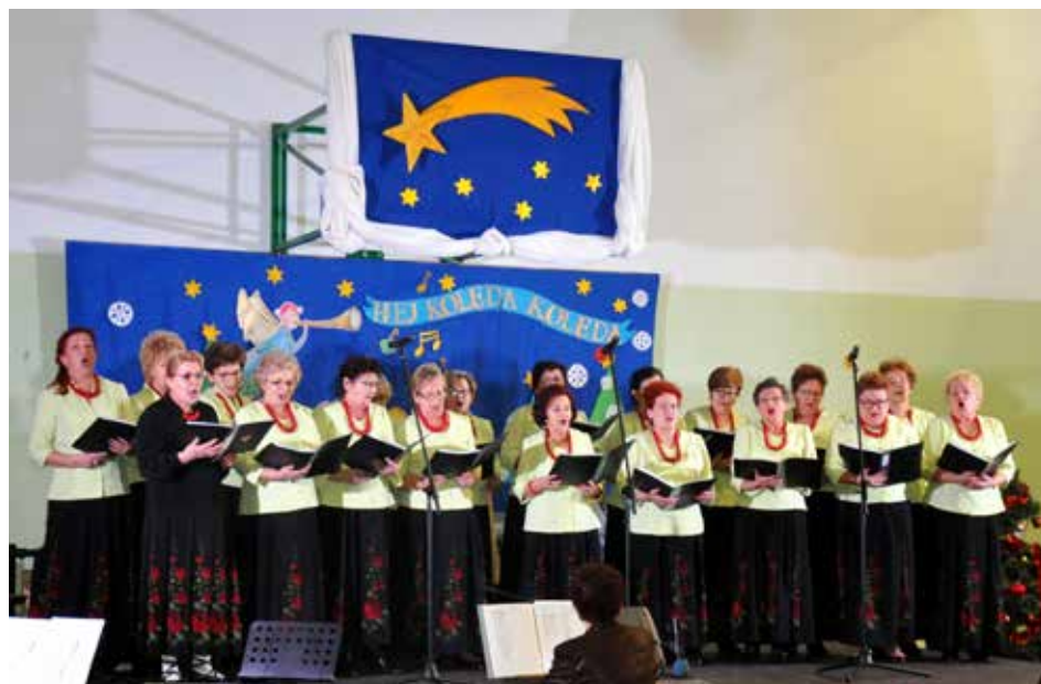
Koncert kolęd w wykonaniu Chóru „Dominanta”, fot. archiwum Pienińskiego UTW w Szczawnicy

My się zimy nie boimy! Po gimnastyce na śniegu lepiiliśmy bałwany (bez żadnych podtekstów!), bo miło jest czasem poczuć się znowu jak dziecko.