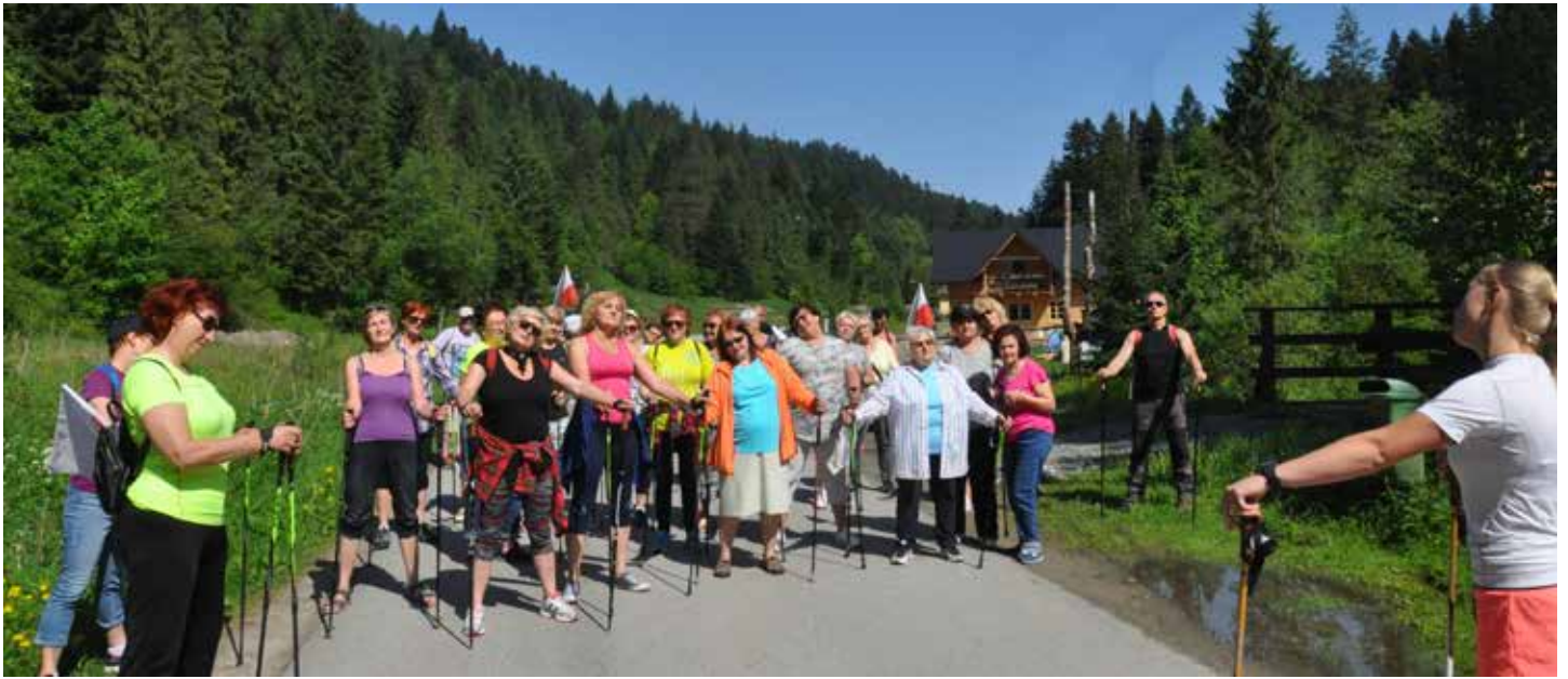
Zajęcia Nordic Walking, fot. archiwum Pienińskiego UTW w Szczawnicy

o pomoc skierowany do słuchaczy Pienińskiego UTW przerósł nasze oczekiwania. Ofiarowywane wciąż i wciąż dary rzeczowe na bieżąco przekazujemy uchodźcom, którzy znaleźli azyl w Szczawnicy. Zaangażowaliśmy się w wolontariat, który przyjął różne formy: bierzemy udział w segregacji darów w miejskim punkcie zbior-